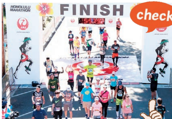
この中にいます。見つけてください！