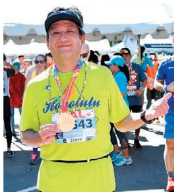
完走メダルを手にニコリ(2019年12月8日ホノルル、ハワイ州、米国)

人間、精神的にも肉体的にも健康でなければ仕事もできませんし娯楽も楽しめません。長寿国の日本ではありますが、健康長寿を目指して久留米大学医療センターのチームの一員として地域医療向上に努めてまいります。どうぞよろしくお祈りします。